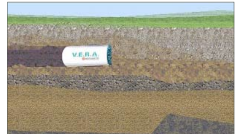
Arcade Spiel VERA: Der Tunnelbohrer bohrt sich durch den Hamburger Untergrund.