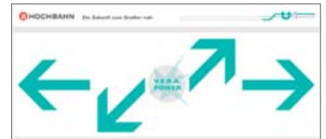
Die Steuerung erfolgt per Projektion auf dem Boden vor dem U4 Pavillon.