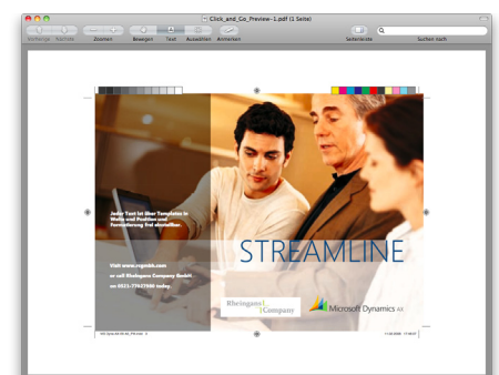
Ausgabe individuell gestalteter druckfähiger PDF Dokumente