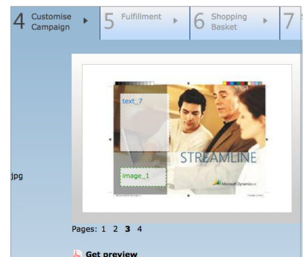
Individuelle Bearbeitung von Text- und Bildfeldern